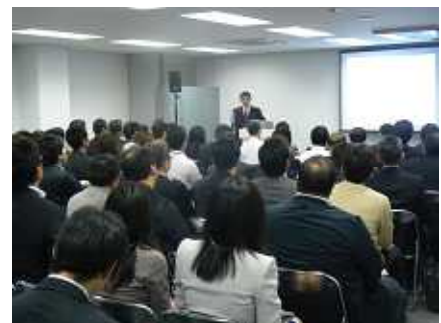
< ネットスーパー特別セミナー会場風景 >